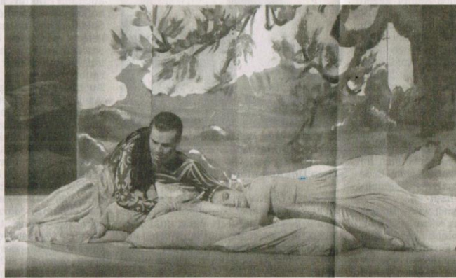
Durchaus märchenhaft geht es zu in der Bad Orber Produktion von Wolfgang Amadeus Mozarts Klassiker „Die Zauberflöte“.

Die weiteren Vorstellungen der Produktion sind heute um 17 Uhr und am morgigen Sonntag, 17. August, um 18 Uhr in der Konzerthalle in Bad Orb. Restkarten jeweils an der Abendkasse. Ralph Philipp Ziegler